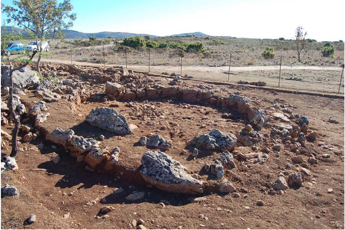
Sito archeologico di Ticci , capanna dell'età del Bronzo