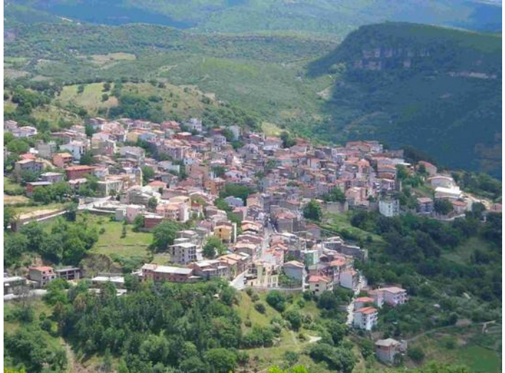
La Barbagia ed il paese di Seulo