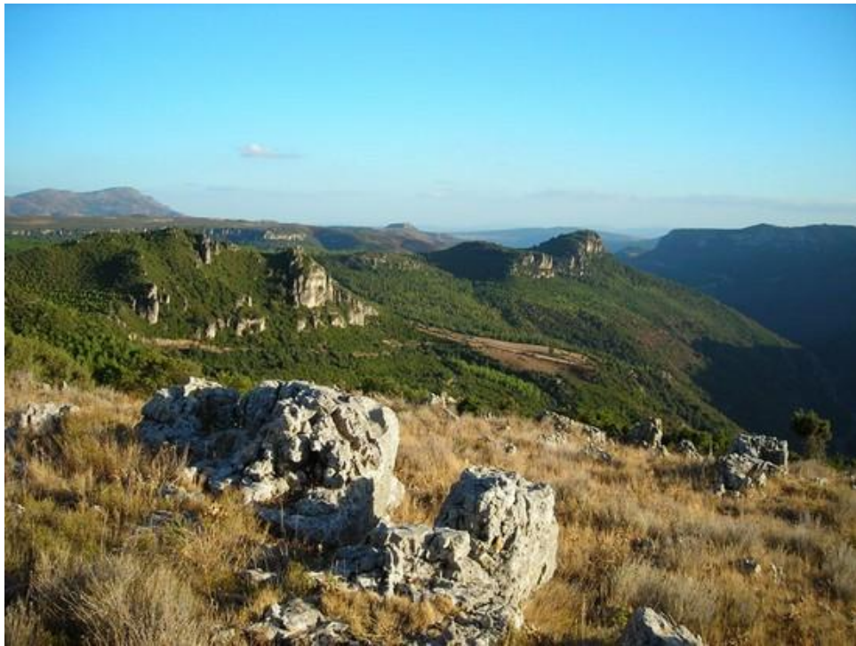
Il paesaggio del territorio di Seulo